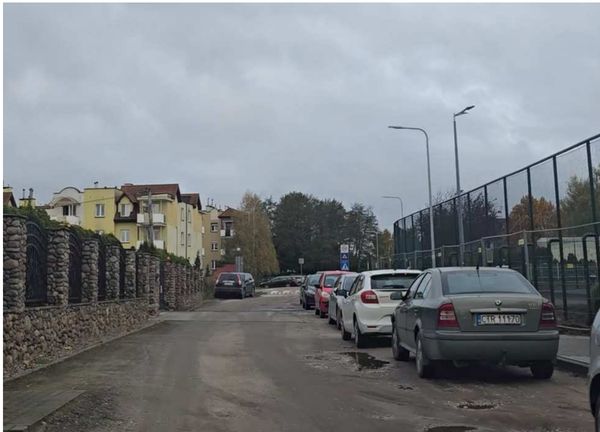
Zdjęcie nr 2 stan istniejący